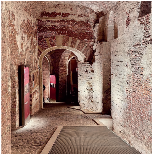
la rue Isabelle

Autrefois, l'impressionnant palais du Coudenberg dominait la ville de Bruxelles. Charles Quint et d'autres souverains parmi les plus puissants que l'Europe ait connus ont habité cette résidence princière du 12 e au 18 e siècle, jusqu'à ce qu'un terrible incendie la détruise à jamais. Les ruines de ce palais ont disparu pendant de nombreuses années dans les sous-sols. Aujourd'hui, ces vestiges forment un site archéologique constitué d'un réseau de salles et de passages souterrains.